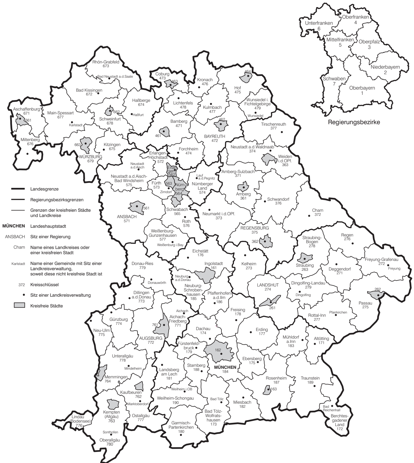
Abb. 1 Verwaltungsbezirksgliederung Freistaat Bayern Kreisfreie Städte, Landkreise und Regierungsbezirke Stand: 31. Dezember 2014